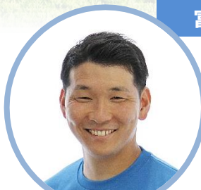
元フットサル 日本代表 富広洋平